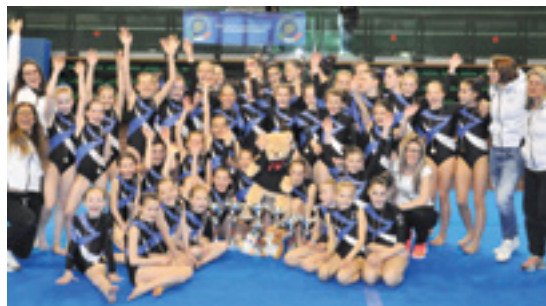
Gare regionali e nazionali