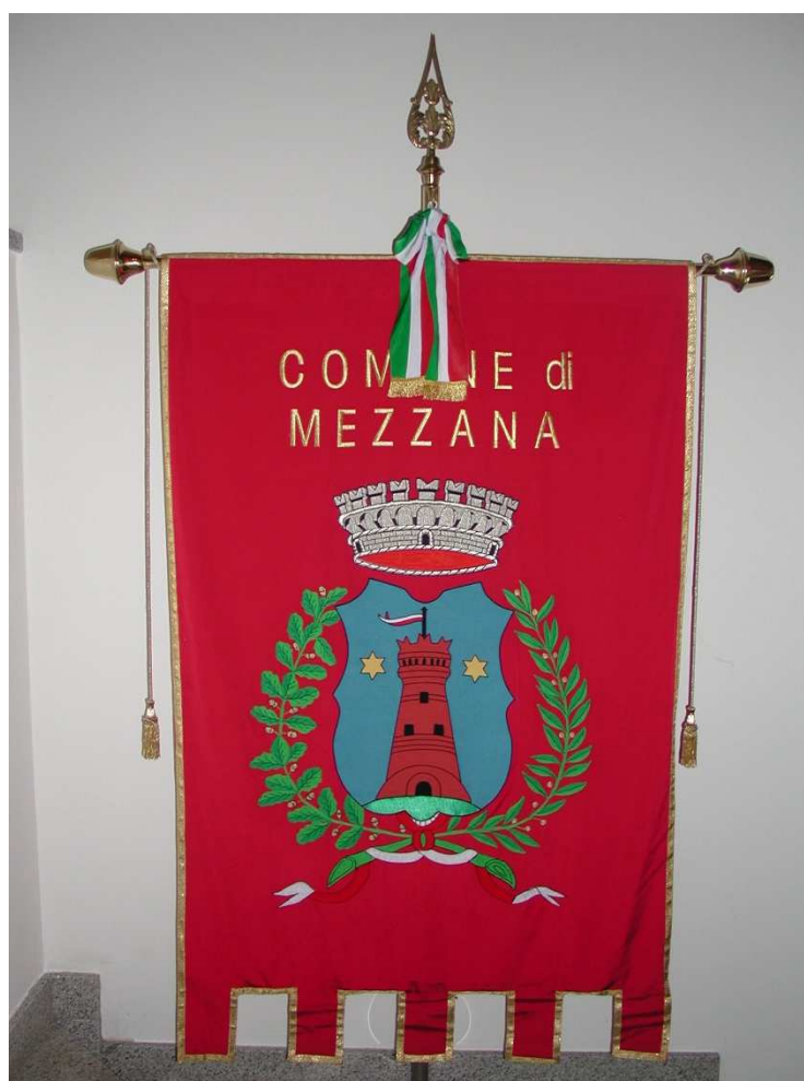
Gonfalone del Comune