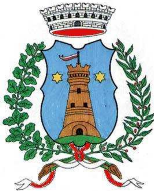
Stemma del Comune

Allegato A) dello Statuto del Comune di Mezzana provincia di Trento