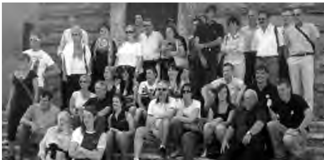
Foto di gruppo durante la gita a Montepulciano e Montalcino

Sicuramente possiamo essere pienamente soddisfatti, sia per i risultati ottenuti, sia per la partecipazione alle attività proposte e per l'aiuto e la presenza sempre numerosa che alpini e amici iscritti hanno portato al gruppo; però un doveroso ringraziamento speciale lo dobbiamo spendere a favore delle amiche degli alpini che veramente si sono dimostrate essenziali in un'associazione che da sempre è stata considerata al maschile!!! Già si pensa al programma per il 2012, si pensa alla data per la sagra della Madonna... a come fare più pasti per non rimaner senza alla sagra di Roncio... a dove fare la cena sociale a dove andare in gita a cosa di nuovo si potrà fare... Sicuramente di lavoro ce ne sarà per tutti, e qualsiasi tipo consiglio ma soprattutto di aiuto sarà sempre da noi ben accetto!!