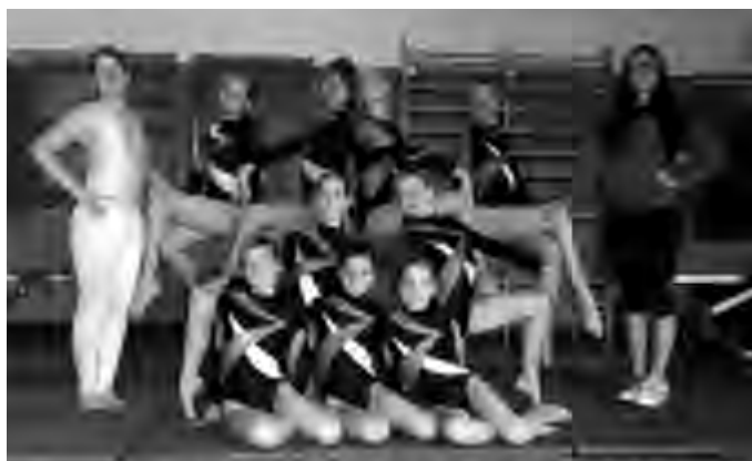
I ragazzi convocati alle gare nazionali di Pesaro