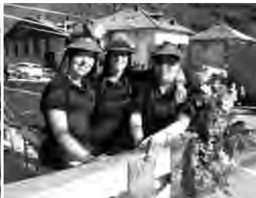
Rappresentanza "Amiche degli Alpini"