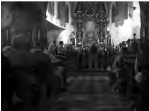
Un momento della celebrazione

Stava per nascere uno dei primi Cori a "voci miste" e proprio per questo avevo notato l'incertezza in alcuni cantori abituati a vedere un coro della montagna rigorosamente composto da sole voci maschili. C'era tanta voglia di imparare per proporsi al pubblico, ma la proverbiale cautela e perfezione del maestro frenò l'entusiasmo. Per far capire loro che erano sulla buona strada, una sera portai un registratore e senza che si accorgessero registrai alcune canzoni. Si ascoltarono e si accorsero delle tante imperfezioni, ma