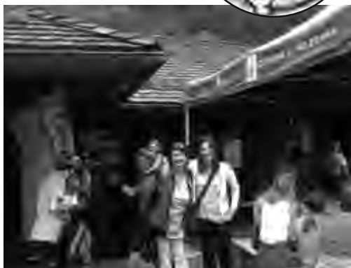
Il Comitato "Acqua Valle di Sole" fa sosta a Mezzana