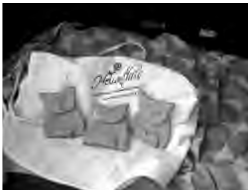
I gadget realizzati nei laboratori estivi